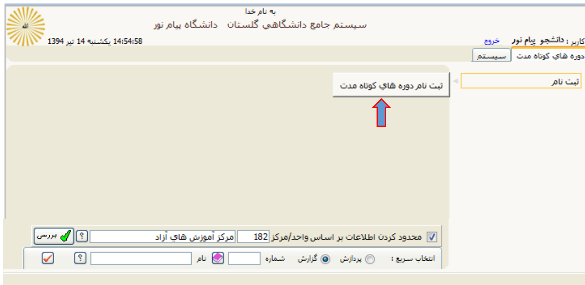
تصویر شماره 5 - صفحه کاربری جدید

از منوی "ثبت نام" ، "ثبت نام دوره‌های کوتاه مدت" را انتخاب کنید.