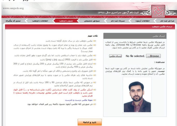
(تصویر شماره دو)

این داوطلبان بعد از بارگیری عکس و تأیید، وارد محیط تقاضانامه شده و لازم است نسبت به تکمیل بندهای تقاضانامه ثبت نام اقدام نمایند.