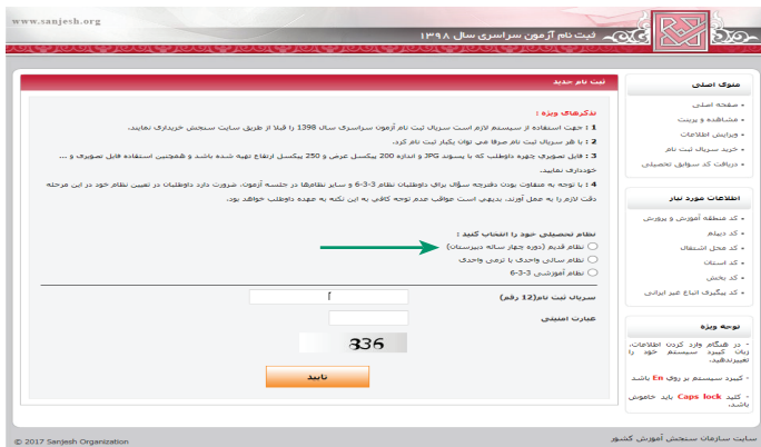
(تصویر شماره یک)

داوطلبانی که نظام قدیم را در تصویر شماره یک به شرح ذیل انتخاب می نمایند وارد صفحه «ارسال عکس داوطلب» (تصویر شماره ۲) شده و اقدام به بارگذاری عکس خود طبق دستورالعمل مندرج در این تصویر می نمایند.