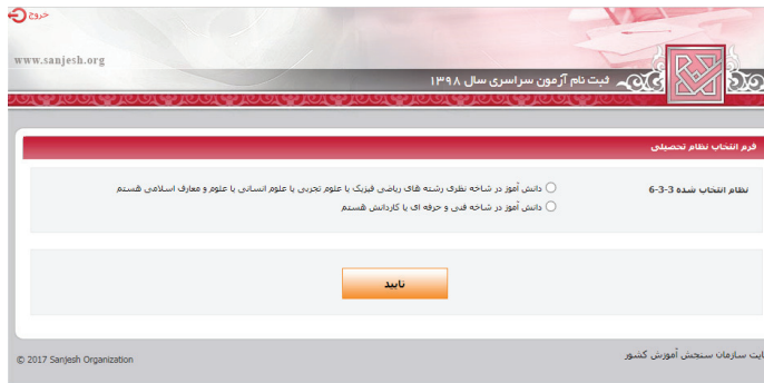
(تصویر شماره چهار)

➤ آن دسته از داوطلبان نظام جدید ۳-۳-۶ که (مطابق تصویر شماره ۴) بند مربوط به «دانش آموز شاخه نظری رشته‌های ریاضی فیزیک، علوم تجربی، علوم انسانی و علوم معارف اسلامی هستم» را علامتگذاری می‌نمایند وارد محیط دریافت کد سوابق تحصیلی و مشاهده مشخصات شناسنامه‌ای می‌شوند که پس از مشاهده و تأیید اطلاعات، این داوطلبان وارد صفحه بارگذاری عکس (تصویر شماره ۲) شده و پس از بارگذاری و تأیید عکس وارد محیط تقاضانامه ثبت نامی می‌شوند. ➤ ضمناً آن دسته از داوطلبانی که بند مربوط به «دانش آموز شاخه فنی و حرفه‌ای یا کاردانش هستم» را علامتگذاری می‌نمایند (طبق تصویر شماره ۴) وارد صفحه بارگذاری عکس (تصویر شماره ۲) شده و پس از بارگذاری و تأیید عکس وارد محیط تقاضانامه ثبت نامی می‌شوند.