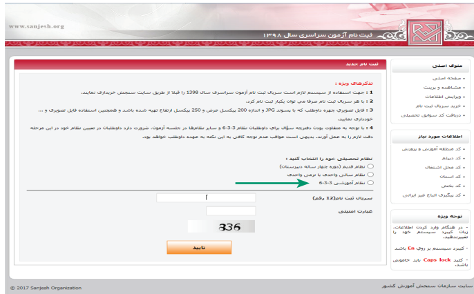
(تصویر شماره یک)

➤ داوطلبانی که نظام آموزشی جدید ۳-۳-۶ را در تصویر یک به شرح ذیل انتخاب می‌نمایند وارد محیط فرم انتخاب نظام تحصیلی (تصویر شماره ۴) به شرح زیر می‌شوند.