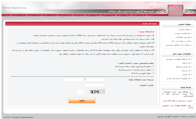
(تصویر شماره یک)

داوطلبان با ورود به صفحه «ثبت نام جدید» (تصویر شماره یک) می توانند نظام تحصیلی خود را با یکی از حالت های ذیل انتخاب نموده و با درج سریال ۱۲ رقمی ثبت نام، وارد فرایند روند ثبت نام شوند. تذکر مهم: با توجه به متفاوت بودن دفترچه سؤال برای داوطلبان نظام ۳-۳-۶ و سایر