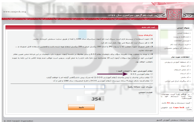
(تصویر شماره یک)

➤ داوطلبانی که نظام آموزشی جدید ۳-۳-۶ را در تصویر یک به شرح ذیل انتخاب می نمایند وارد محیط فرم انتخاب نظام تحصیلی (تصویر شماره ۲) به شرح زیر می شوند.