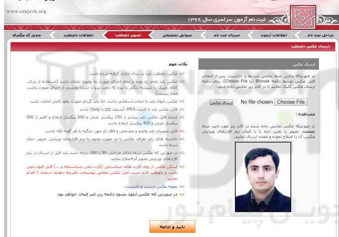
(تصویر شماره چهار)

کلیه داوطلبان حالت‌های اول تا سوم پس از تکمیل تقاضانامه ثبت‌نام لازم است نسبت به پرینت تقاضانامه تکمیل شده که حاوی اطلاعات داوطلب و همچنین شماره پرونده ۷ رقمی و کد پیگیری ثبت‌نام ۱۶ رقمی می‌باشد اقدام نمایند.