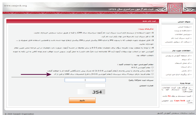
(تصویر شماره یک)

این داوطلبان بعد از بارگیری عکس و تأیید، وارد محیط تقاضانامه شده و لازم است نسبت به تکمیل بندهای تقاضانامه ثبت‌نام اقدام نمایند.