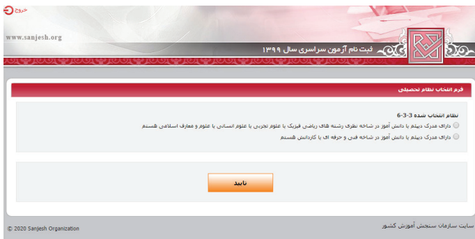
(تصویر شماره دو)

➤ آن دسته از داوطلبان نظام جدید ۳-۳-۶ که (مطابق تصویر شماره ۲) بند مربوط به «دانش آموز شاخه نظری رشته های ریاضی فیزیک، علوم تجربی، علوم انسانی و علوم معارف اسلامی هستیم» را علامتگذاری می نمایند وارد محیط دریافت کد سوابق تحصیلی و مشاهده مشخصات شناسنامه ای می شوند که پس از مشاهده و تأیید اطلاعات، این داوطلبان وارد صفحه بارگذاری عکس (تصویر شماره ۴) شده و پس از بارگذاری و تأیید عکس وارد محیط تقاضانامه ثبت نامی می شوند.