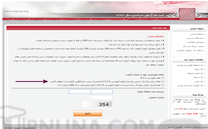
(تصویر شماره یک)

➤ داوطلبانی که نظام سالی واحدی یا ترمی واحدی را در تصویر یک به شرح ذیل انتخاب می‌نمایند وارد محیط فرم انتخاب نظام تحصیلی خواهند شد. (مطابق تصویر شماره ۳)