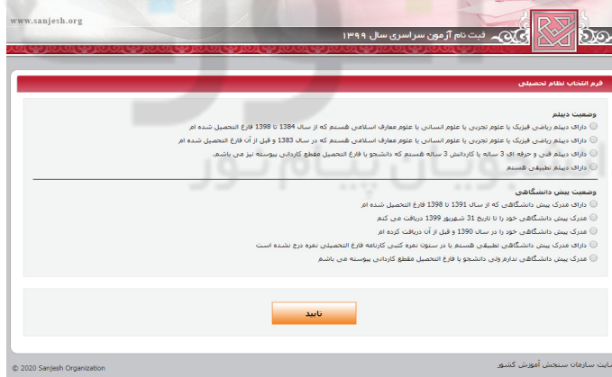
(تصویر شماره سه)

➤ داوطلبان لازم است با توجه به سال اخذ دیپلم و یا پیش‌دانشگاهی و یا مدرک کاردانی، نسبت به علامتگذاری موارد مندرج در این صفحه اقدام نموده که در این صورت داوطلبان با توجه به نوع علامتگذاری بندها، کسانی که مشمول سوابق تحصیلی هستند با ورود کد سوابق تحصیلی و کد دانش‌آموزی و سپس مشاهده سوابق تحصیلی خود اقدام نمایند. این داوطلبان پس از تأیید سوابق تحصیلی وارد صفحه بارگذاری عکس (تصویر شماره ۴) شده و پس از بارگذاری وارد محیط تقاضانامه ثبت‌نامی شده و نسبت به تکمیل بندهای مورد نیاز اقدام نمایند. ➤ برخی از داوطلبان نیز که مشمول سوابق تحصیلی نمی‌باشند، وارد صفحه بارگذاری عکس (تصویر شماره ۴) شده و پس از بارگذاری و تأیید عکس وارد محیط تقاضانامه ثبت‌نامی می‌شوند.